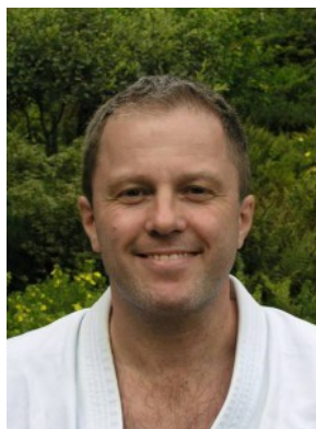
8. Dan Shito-ryu