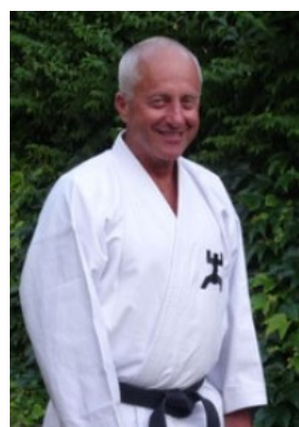
6. Dan Goju-ryu