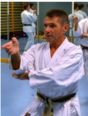
7. Dan Shotokan-ryu